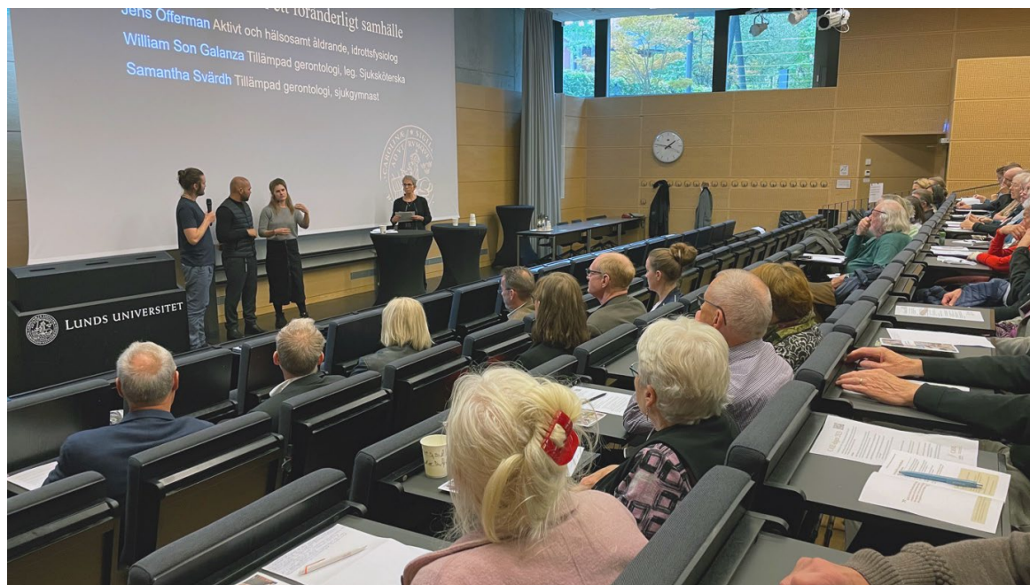
CASE-dagen 2023 drog fullt hus.