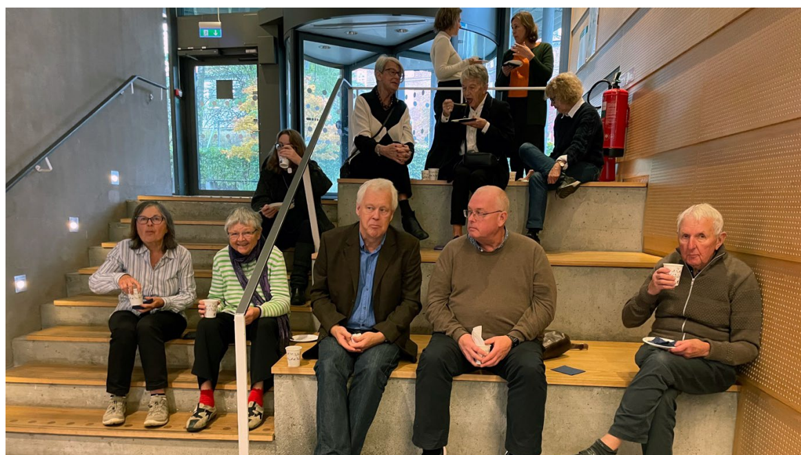
Fikastund mellan föreläsningarna på CASE-dagen.