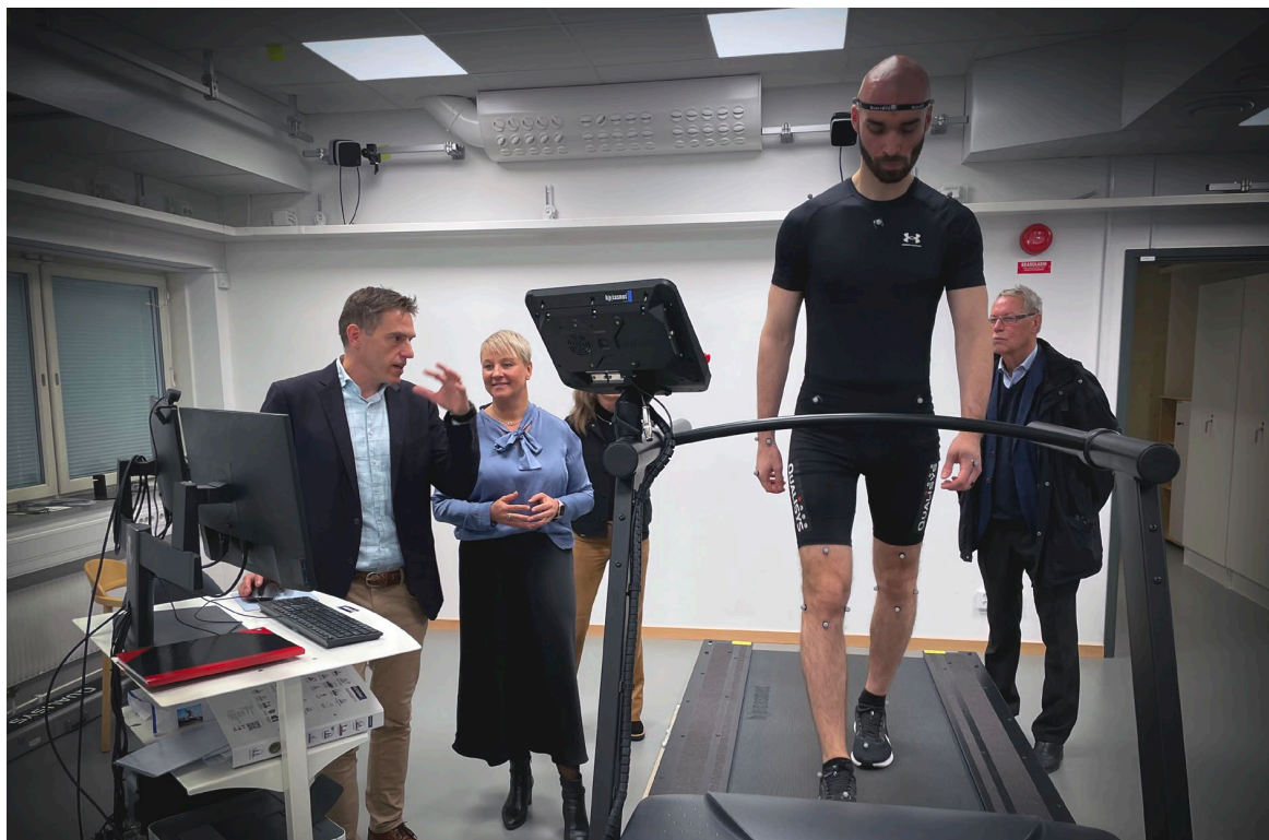
Äldre- och socialförsäkringsminister Anna Tenje invigningstalade och besökte bland annat MoRe-Lab på CASE-dagen 2023.

Äldre- och socialförsäkringsminister Anna Tenje (M) gästade CASE-dagen och stod för öppningsanförandet. Hon fick även en rundtur i nya Forum Medicum och testmiljön MoRe-Lab (Movement & Reality Lab), där det forskas på bland annat äldres rörelsemönster i hemmiljö.